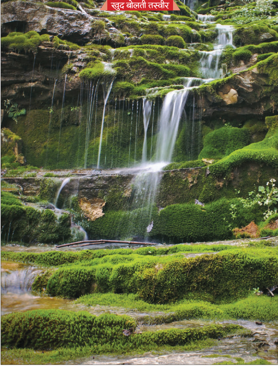
खुद बोलती तस्वीर