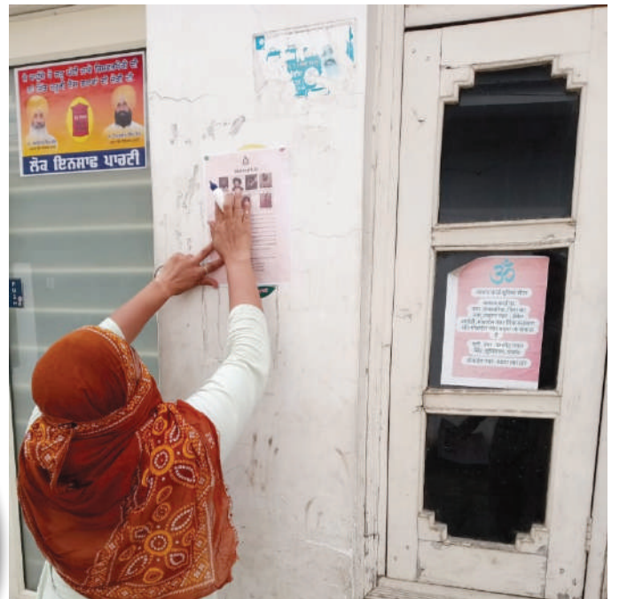
पुलिस की कार्यशैली सवालों के घेरे में: वकील ढांडा

दिये गये हैं। उन्होंने आम जनता से भी आरोपियों के बारे में जानकारी साझा करने की अपील की। बराड़ ने कहा कि उनकी कई टीमों इस मामले में आरोपियों को गिरफ्तार करने के लिए कार्य कर रही हैं। और जल्द ही उन्हें गिरफ्तार कर लिया जाएगा। बैस के फेसबुक पर लाइव होने के सवाल पर उन्होंने कहा कि इस मामले में जल्द फेसबुक से संपर्क साधते हुए बैस की लोकेशन ट्रैस की जाएगी। ताकी उनकी गिरफ्तारी कर उसे सलाखों के पीछे डाला जा सके।